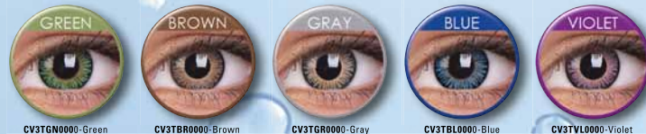
CV3TGN0000-Green CV3TRB0000-Brown CV3TGR0000-Gray CV3TBL0000-Blue CV3TVL0000-Violet

Eine natürliche Linse mit dezentem Farbwechsel. Die natürlichste 3-Farbtönen der Welt! Wunderschöne Designs in 3 Farbtönen für helle und dunkle Augen. Verpackung: 2 Linsen pro Packung. Tragedauer 3 Monate. Stärken: PLANO (0,0 Dioptrien), -0,5 bis -5,0 in 0,25er Schritten, -5,5 bis -8,0 in 0,50er Schritten. Wassergehalt 45 %.