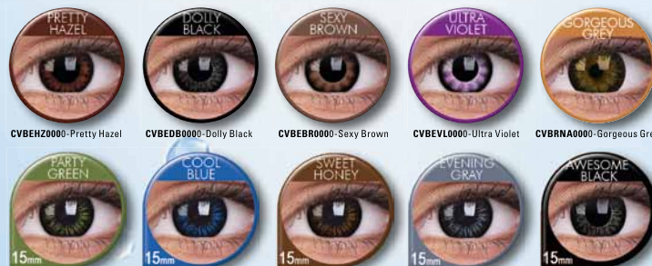
CVBEH20000-Pretty Hazel CVBEDB0000-Dolly Black CVBEBR0000-Sexy Brown CVBEVL0000-Ultra Violet CVBRNA0000-Gorgeous Grey CVBEGN0000-Party Green CVBEL0000-Cool Blue CVBEHY0000-Sweet Honey CVBEGR0000-Evening Gray CVBEAB0000-Awesome Black

Für große, niedliche Puppenaugen. Die breiten, dunklen Ringe um die Iris und die acht natürlichen Farben machen die Augen noch größer, noch strahlender. Auch in 15 mm für besonders große Augen. Für helle und dunkle Augen. Verpackung: 2 Linsen pro Packung. Tragedauer 3 Monate. Stärken: PLANO (0,0 Dioptrien), -0,5 bis -5,0 in 0,25er Schritten, -5,5 bis -8,0 in 0,50er Schritten. Wassergehalt 45 %.